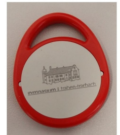
Chip in Form eines Schlüsselanhängers

Das Passwort kann/sollte anschließend geändert werden. Im nächsten Schritt der Onlinebestellung gelangen