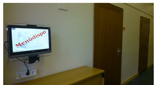
Bestellterminal Raum A007

Bestellung über https://opc-asp.de/gym-tt