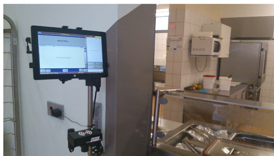
opc-Menüausgabeterminal mit Chipablage

Startseite der online-Bestellung über https://opc-asp.de/gym-tt